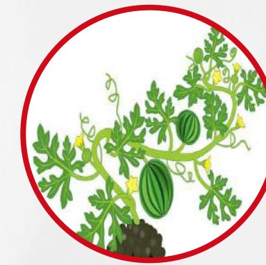
Développement des fruits