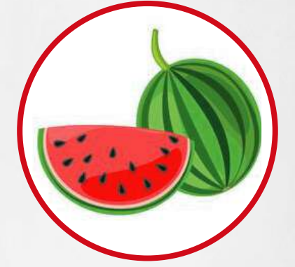
Maturation des fruits

ROOT Solution Humic Solution 08-08-08 Solution